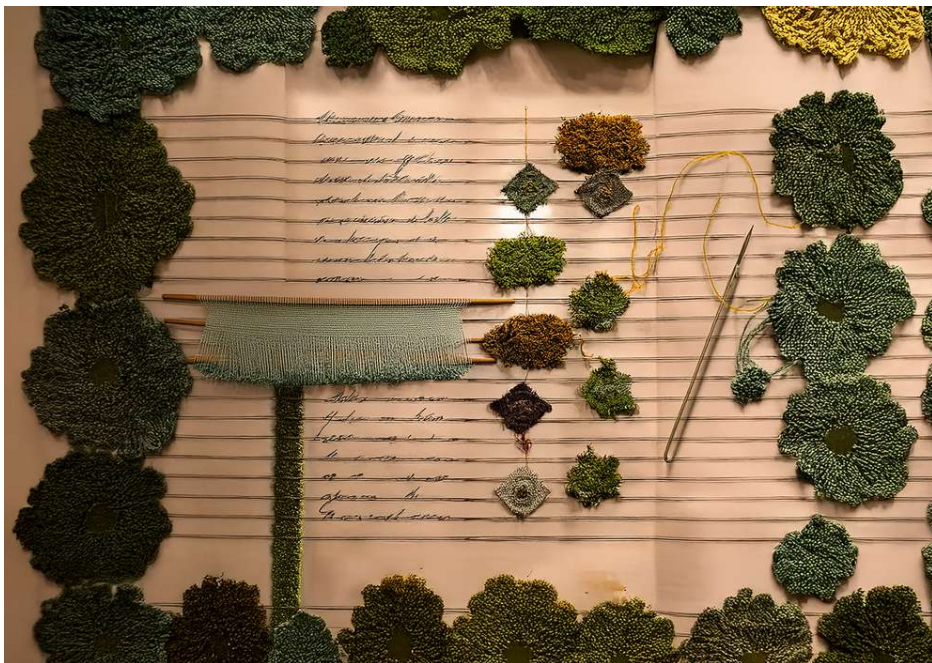
Tessere storie © Isobel Blank, digital sketches for future visions, dimensioni variabili, 2025